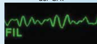
Gefiltertes EKG-Signal mittels See-Thru CPR