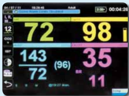
Darstellung numerischer Anzeigen