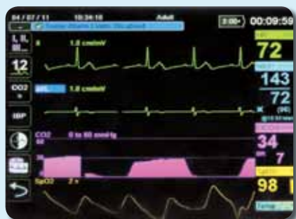
Darstellung von vier Kurven