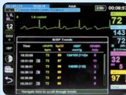
Darstellung von Trend Informationen