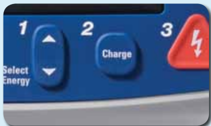
Simpel wie 1-2-3