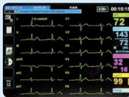
Darstellung des 12-Kanal EKG