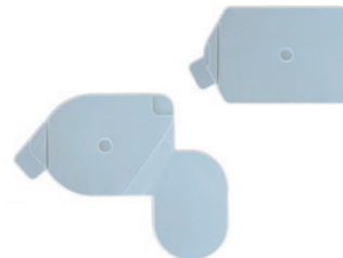
CPR Uni-padz 培训电极片可替换衬垫 货号 8028-000013