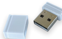
培训机软件升级 U 盘 货号 8028-000011-XX