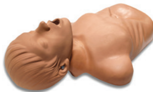
培训用模拟人 货号 8000-0835-01