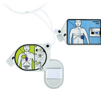
Trainer CPR Uni-padz® 电极片替代凝胶 货号 8028-000014 (一盒 5 个)