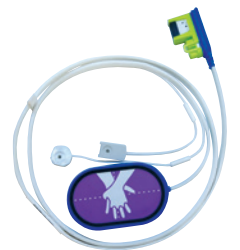
CPR Uni-padz 培训电极片中的 CPR 传感器及线缆组件 货号 8028-000010

ZOLL Medical Corporation 全球总部 269 Mill Road Chelmsford, MA 01824 978-421-9655 800-804-4356