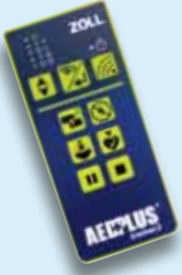
Ersatz AED Plus Trainer2-Fernbedienung