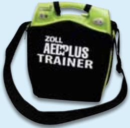
AED Plus Trainer-Tragetasche