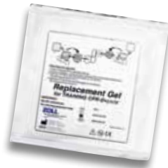
Ersatz-Klebegels für CPR-D-padz- Trainingselektroden

(Ersatzteile müssen separat bestellt werden)