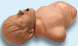
AED Plus Trainer-Demo-Übungspuppe