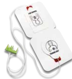
Pedi-padz® II-Trainingselektroden (VE: 6)