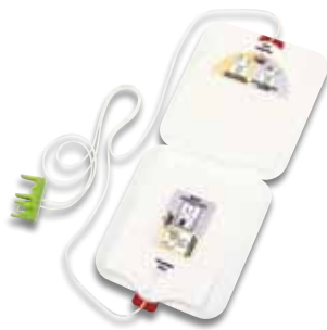
Stat-padz® II-Trainingselektroden (VE: 6)