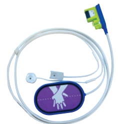
CPR Uni-padz Übungs-Elektrodenkabel ArtikelNr.: 8028-000010