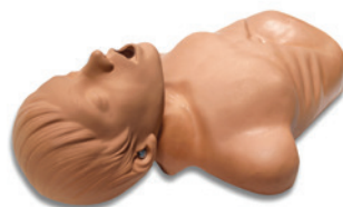
Trainer Demo-Übungspuppe ArtikelNr.: 8000-0835-01