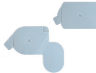
Trainer CPR Uni-padz Ersatz-Folienstreifen für Elektroden ArtikelNr.: 8028-000013