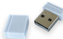
Trainer USB Softwareupgrade-Set ArtikelNr.: 8028-000011-XX